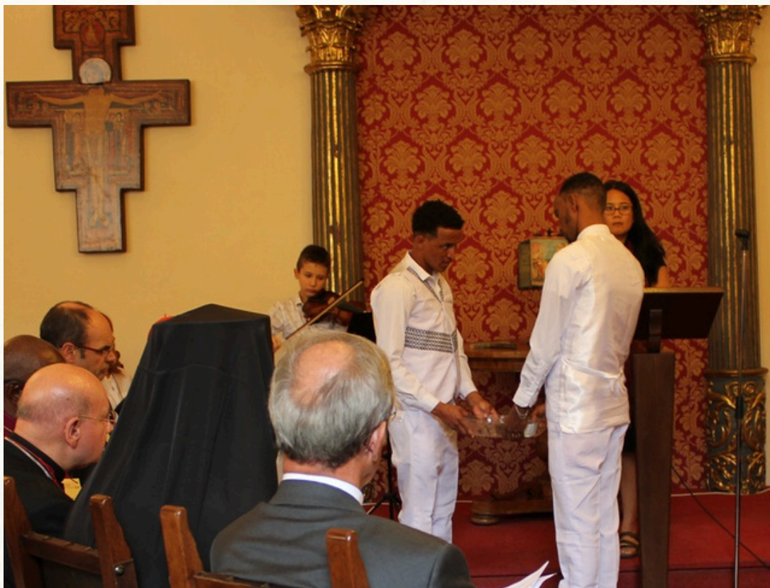
Première prière œcuménique pour la Création, Assise, 31 août 2018

Vous pouvez également inviter différents membres de votre communauté, ainsi que des membres de communautés vulnérables touchées par la crise climatique, à apporter un peu d'eau de leur « foyer/contexte » et à la verser dans le bol.