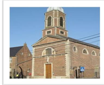
Saint Martin Opheylissem