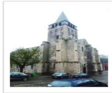
Saints Martin et Adèle Orp